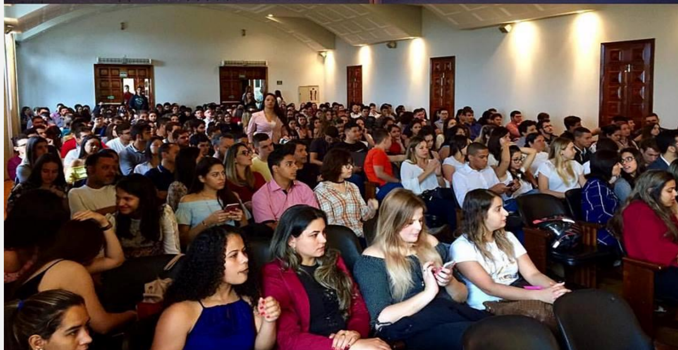
Mesa da audiência pública composta pelas autoridades e público que compareceu ao evento